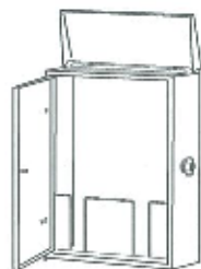
【別途ご用意下さい】