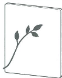
ブランシュパネル 1枚